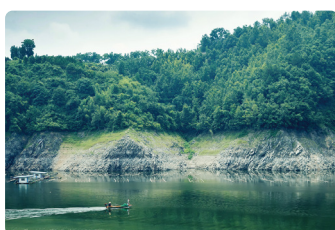
Levantamiento de Recursos Hídricos