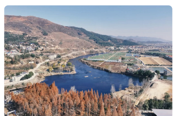
Rescate de Emergencia