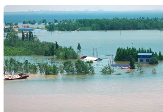
Dragado de Canales