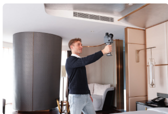
インテリア、リフォーム、リノベーション