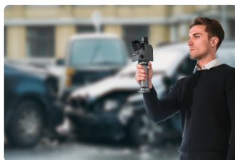
公共安全・事故調査